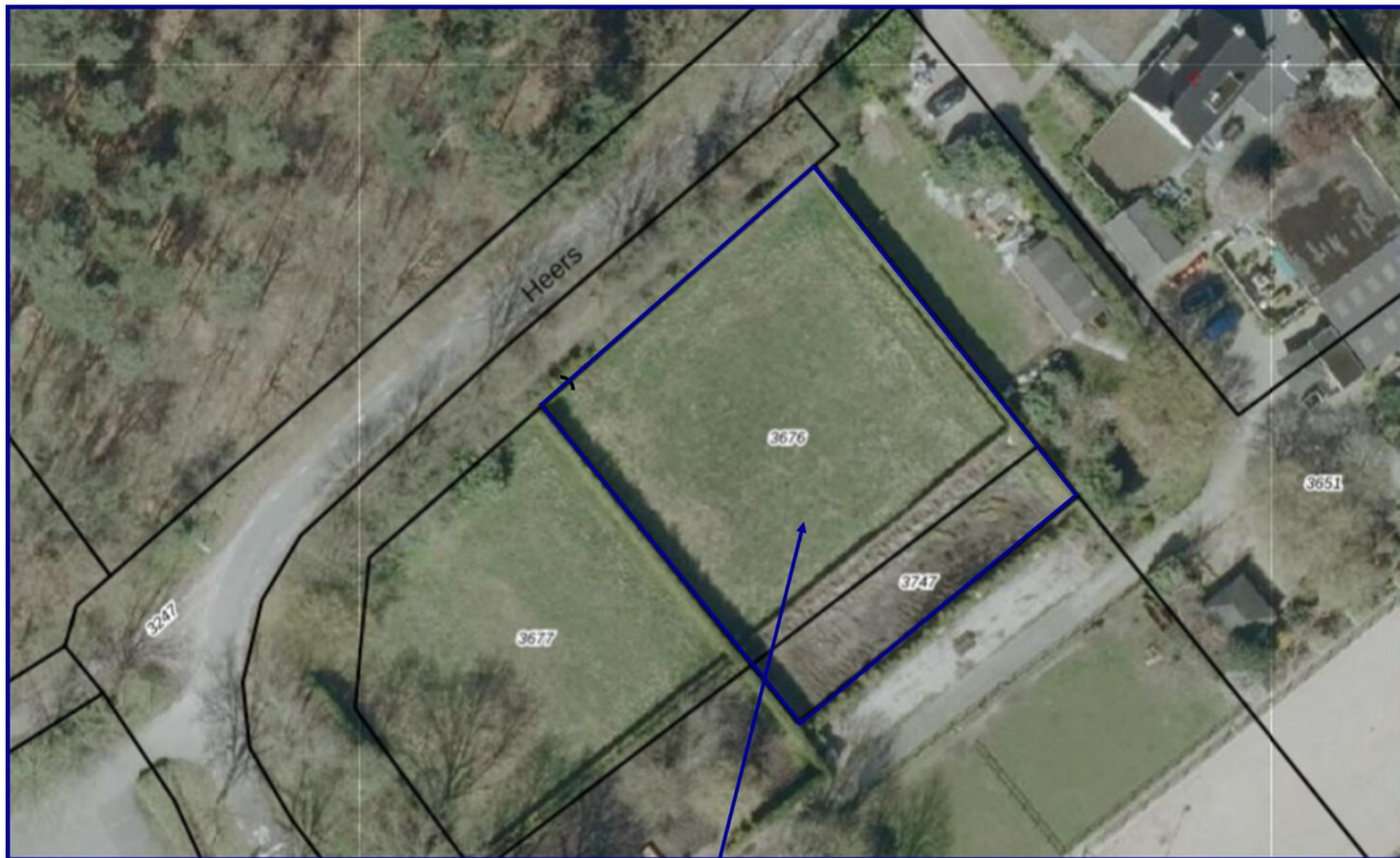
Bouwlocatie Heers Veldhoven